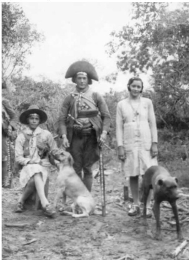
Imagem no tamanho original