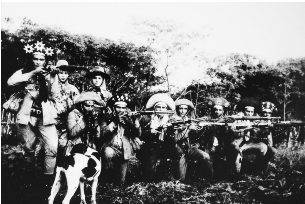
Imagem no tamanho original