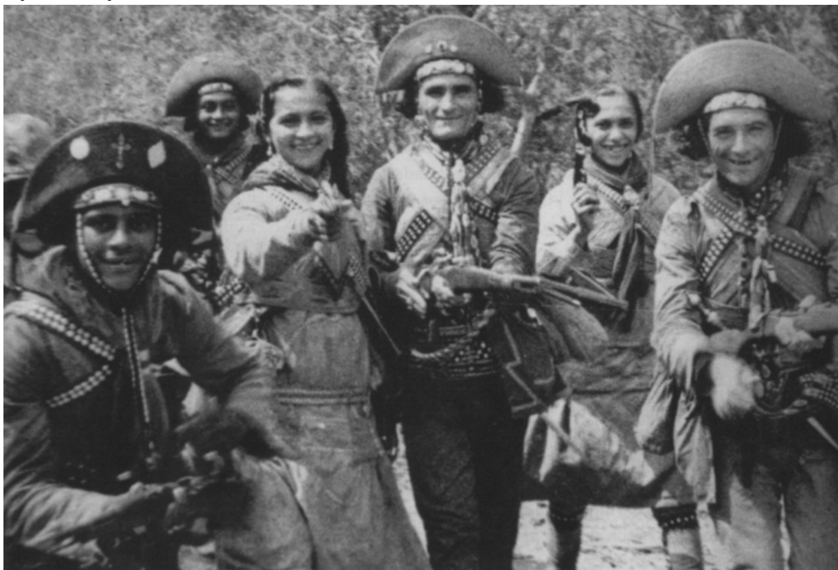
Imagem no tamanho original