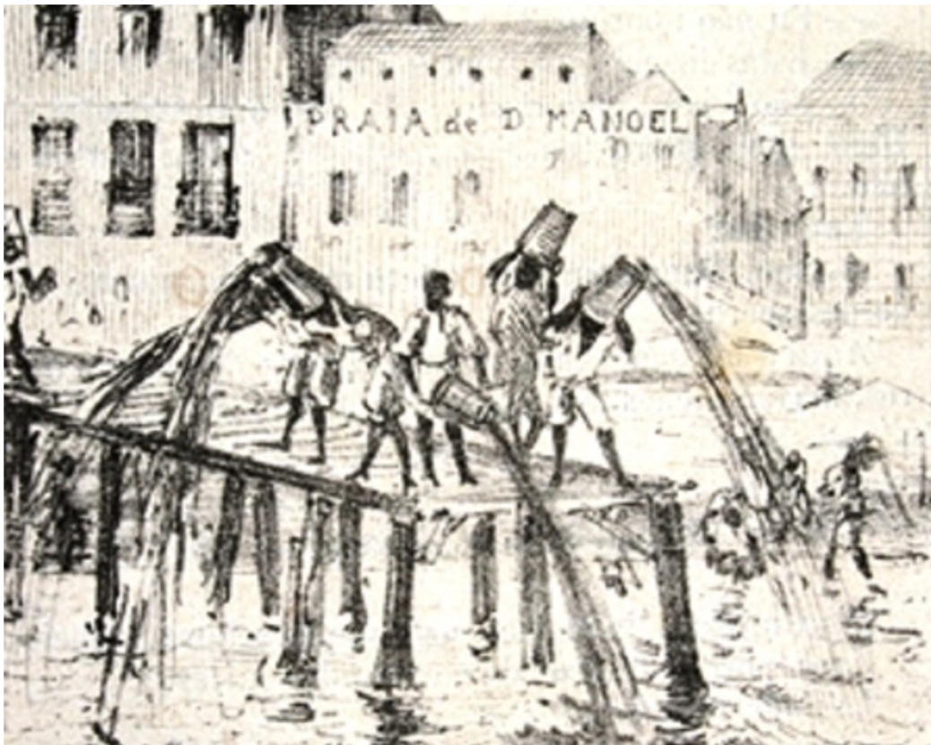
Imagem no tamanho original