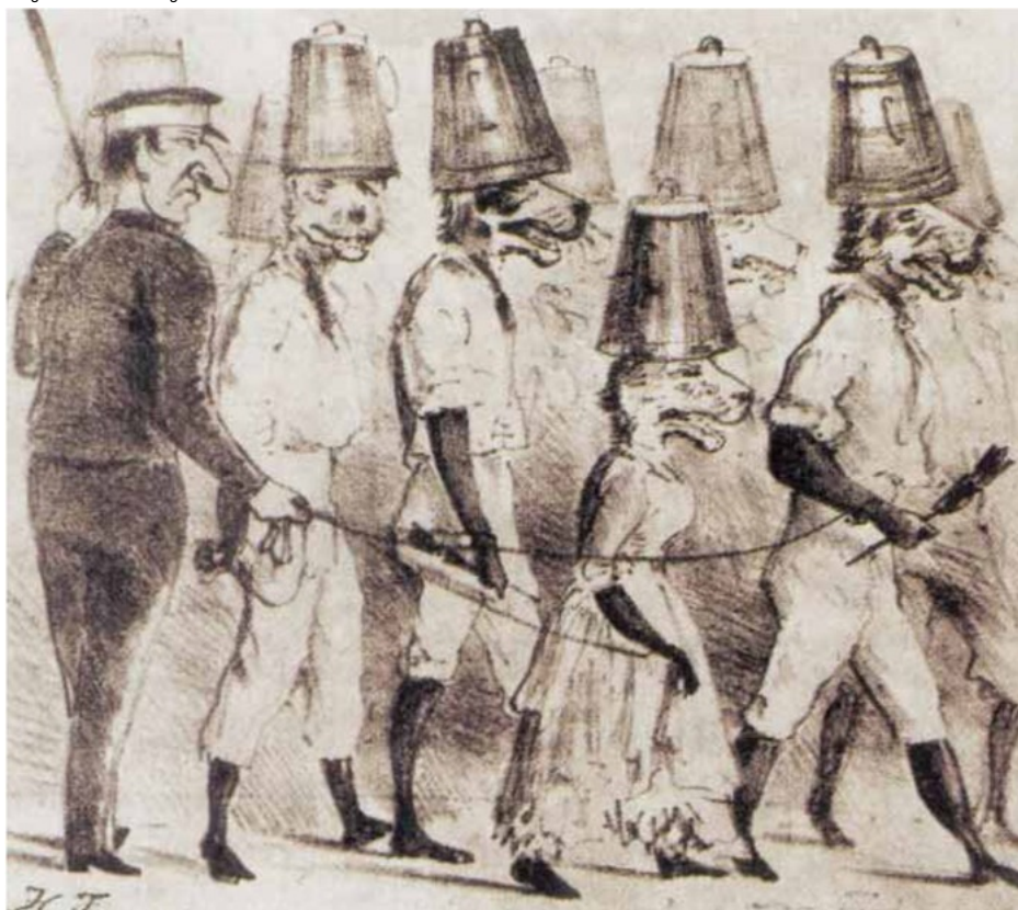
Imagem no tamanho original