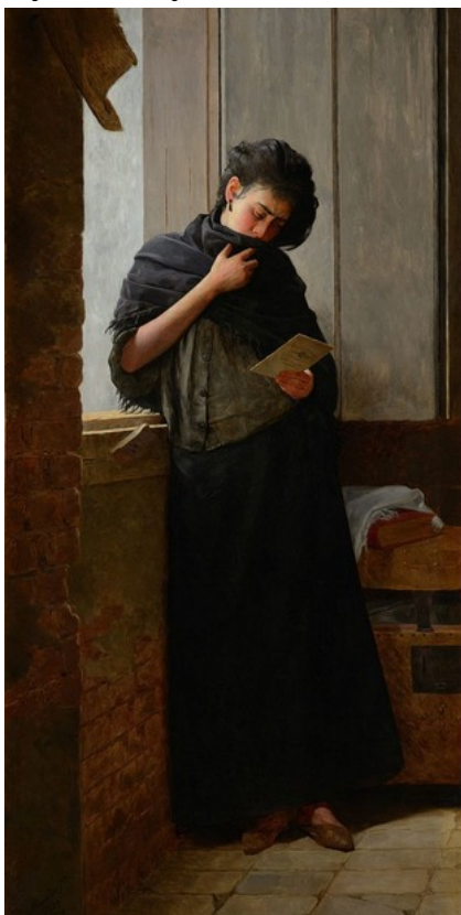
Imagem no tamanho original