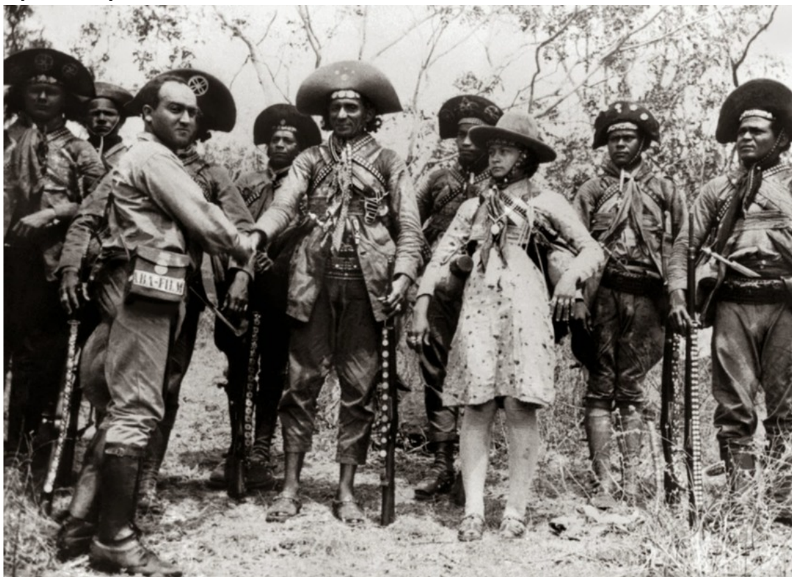
Imagem no tamanho original