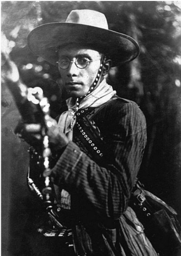
Imagem no tamanho original