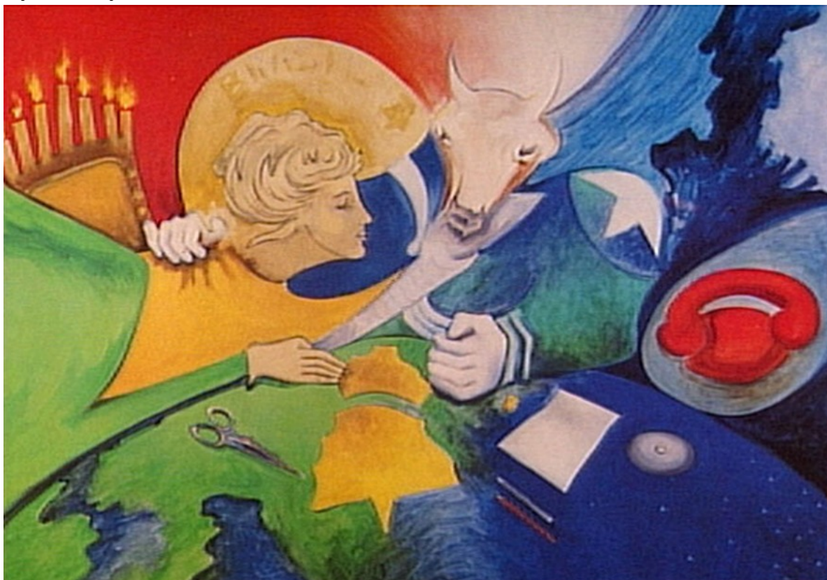
Imagem no tamanho original